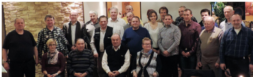
oben: die Mitglieder der AMRS Waldviertel bei der Weihnachtsfeier 2014