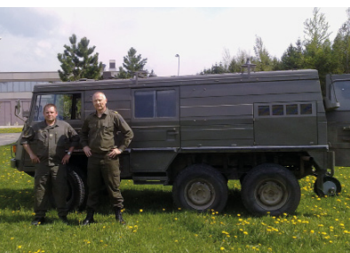
1. Mai 2011: Staatsfunkstelle ÖBH OEY-303 mit OE3EMC und OE3KUS

für den ADL 031 mit vy 73 Paul Widhalm, OE3PU