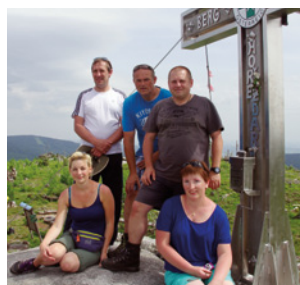
Juni 2015: die SOTA-Gruppe der AMRS Waldviertel am Plöckenstein